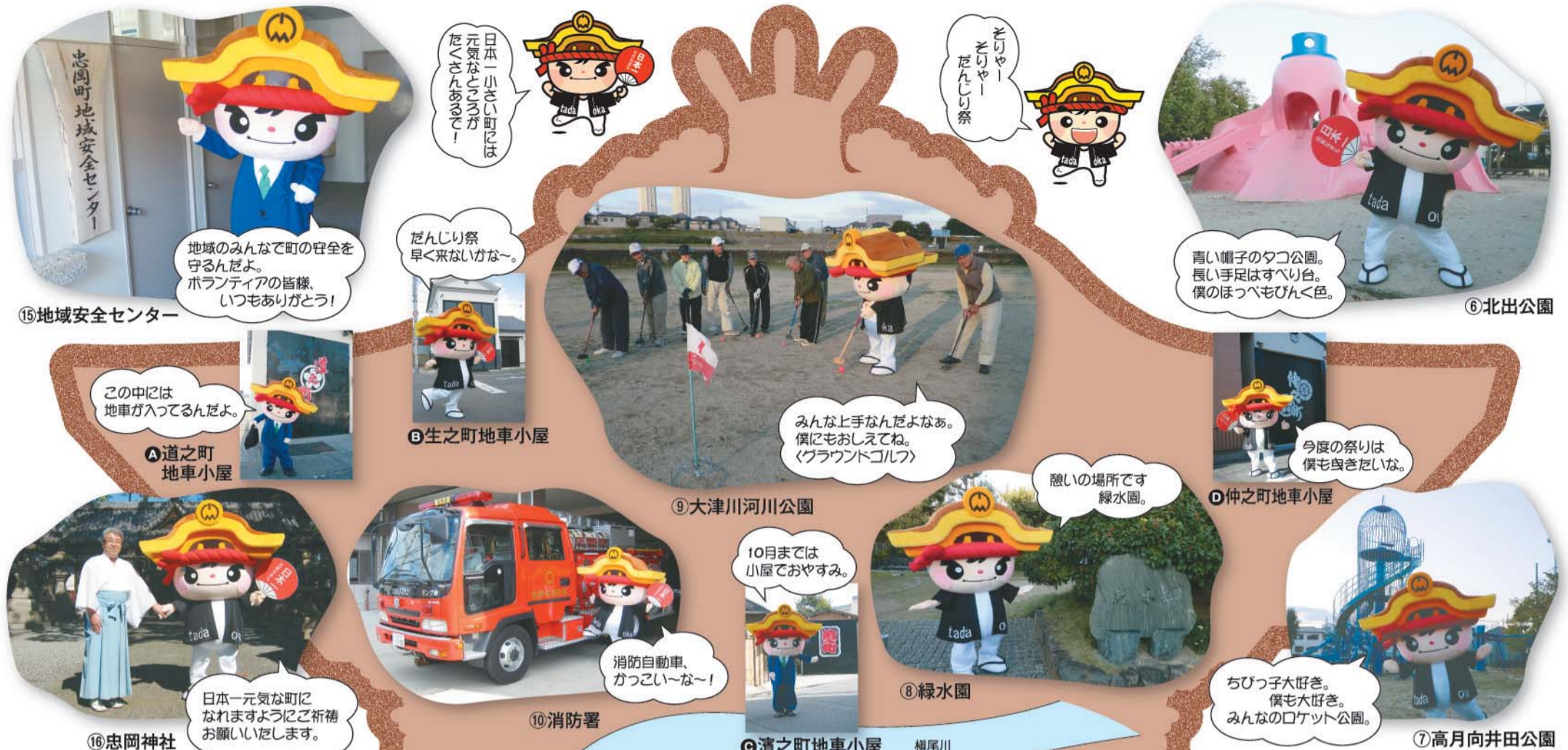
⑮地域安全センター