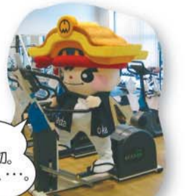
⑭スポーツセンター