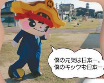
⑬町民いこいの広場