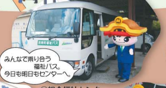
⑪総合福祉センター

小さな町の小さな美術館です。でも国宝3点・重要文化財12点を所蔵しているんだよ。展示会はとてつとでき。僕も感性をみがいていこう。