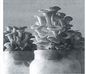
栽培中のたもぎたけ

※詳しくは、忠岡町きのごプロジェクトまでお問い合わせください。[忠岡町商工会 ☎0725-33-3208]