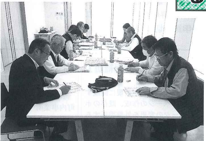
地区総代選挙の開票作業