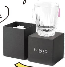
「KINJO JAPAN」のシリコンロックグラス